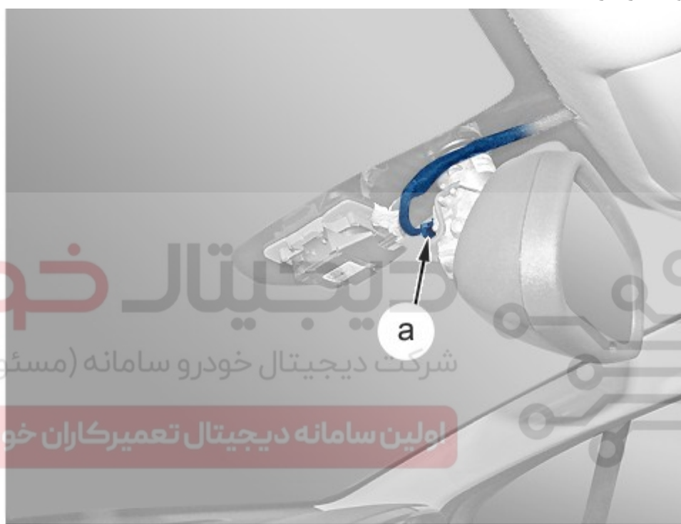
Figure : C5CG222D